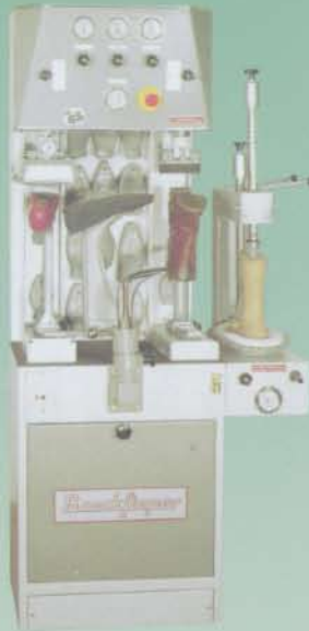
(mit angebauter Preßstelle und Arbeitsständer)