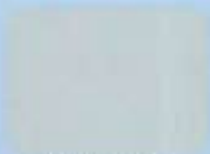
Lichtgrau Ral Nr. 7035

Folgende Lackierungen ohne Aufpreis · Farben sind gedruckt und nicht farbverbindlich!