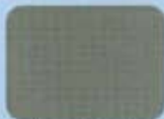
Staubgrau Ral Nr. 7037